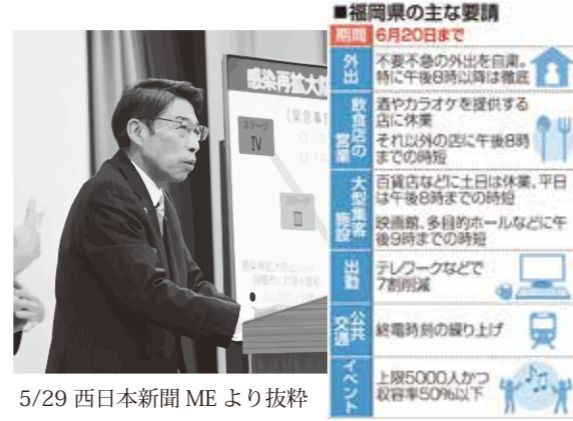
5/29 西日本新聞 ME より抜粋

さて、下記に示す本年4月19日に株式会社メドレー（本社：東京都港区、代表取締役社長：瀧口 浩平）がHPにて発表した、オンライン診療における利用実績データおよびアンケート調査結果によると、自社製 CLINICS を使用するオンライン診療利用医療機関は、本年3月現在で全国約2,300件に広がり、ここ数年で医療機関におけるオンライン診療は格段に広がりを見せており、特に20~40代の登録者が多くなっています。