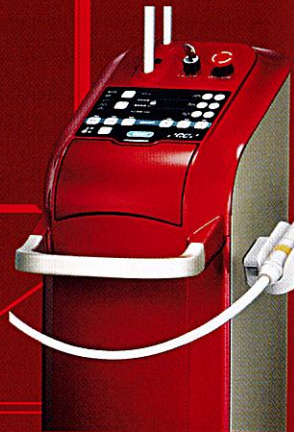
炭酸ガスレーザー ジーシー ガスレーザー Plus 高度管理医療機器 特定保守管理医療機器 23000BZX00030000