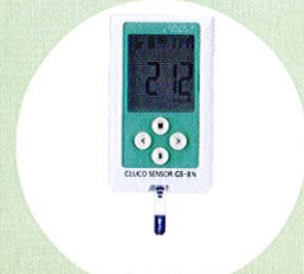
グルコセンサー GS-II N 一般医療機器 特定保守管理医療機器 13B1X00155000311