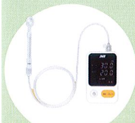
TPM舌圧測定器 TPM-02 管理医療機器 22200BZX00758000