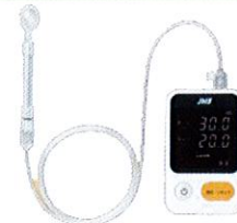
JMS舌圧測定器 TPM-02 管理医療機器 22200BZX00758000