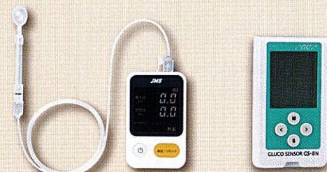
舌圧測定器 JMS舌圧測定器 TPM-02 管理医療機器 22200BZ X00758000