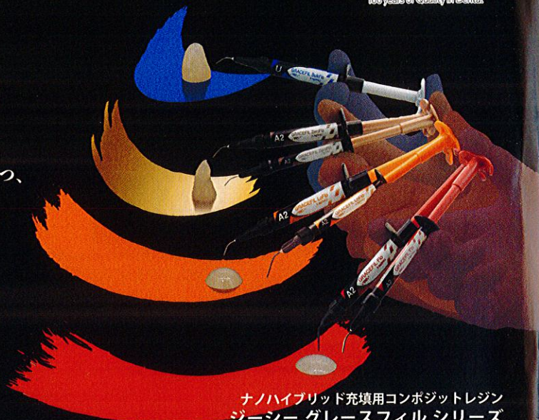
ナノハイブリッド充填用コンポジットレジン ジーシー グレースフィル シリーズ

ジーシー グレースフィル バルクフロー 管理医療機器 230AKBZX00066000 ジーシー グレースフィル ゼロフロー 管理医療機器 229AABZX00014000 ジーシー グレースフィル ローフロー 管理医療機器 229AABZX00013000 ジーシー グレースフィル フロー 管理医療機器 229AABZX00051000