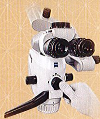
手術顕微鏡 EXTARO 300

一般医療機器 特定保守管理医療機器 手術顕微鏡 EXTARO 300 フロアスタンド 13B1X00119003570 手術顕微鏡 EXTARO 300 マウントタイプ 13B1X00119003590 管理医療機器 特定保守管理医療機器 手術顕微鏡 EXTARO 300 FV (フロアスタンド/マウントタイプ) 229AHBZX00034000